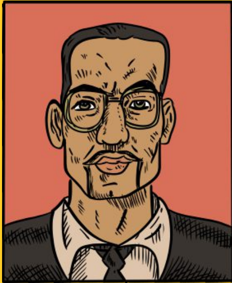
Malcolm X (1925 - 1965)

Foi uma liderança. Ativista do Movimento dos Direitos Civis nos Estados Unidos durante os anos 1960 e um dos inspiradores do movimento Black Power. Discursava contra a injustiça, a opressão e as desigualdades.