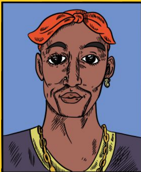
Tupac Shakur (1971 - 1996)

Rapper americano, compositor de letras carregadas de críticas e reflexões. Cantava versos sobre o racismo, contra a violência e a pobreza. Como ativista, era contra a desigualdade, denunciando os privilégios dos milionários.